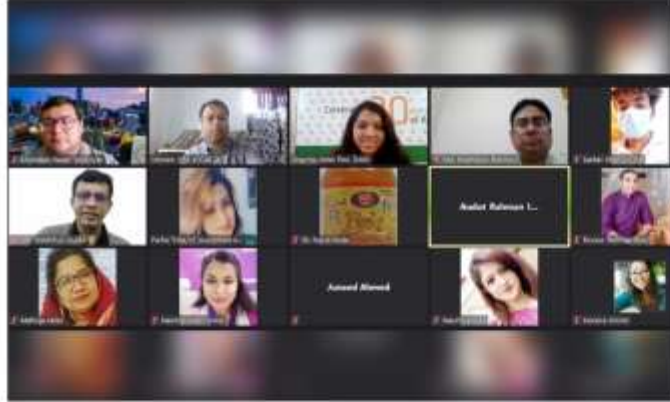
অনলাইন সেমিনারে।

খবিরের মাধ্যমে ই-সিগারেট বন্ধের দাবি জানিয়েছে ই-কমার্শ এনোসিয়েশন অথ বাংলাদেশ (ই-কান)। অক্টোবর (১১ মে) দুপুরে ই-কান ও ঢাকা আহওয়ালিয়া মিশনের যৌথ উদ্যোগে অনূষ্ঠিত এক অনলাইন সেমিনারে এর দাবি জানানো হয়।